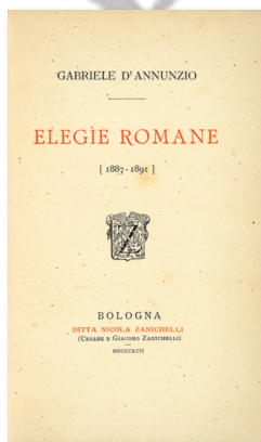
Gabriele D'Annunzio Elegie Romane 1887-1891 1892