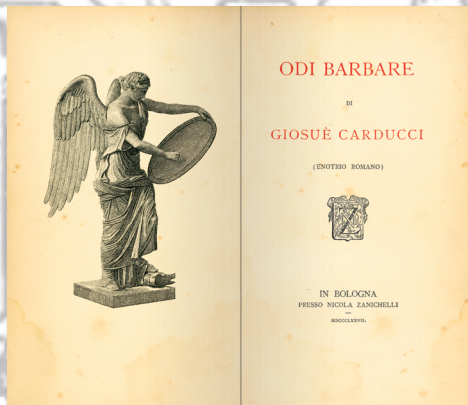
Giosuè Carducci (Enotrio Romano) Odi barbare Collezione elzeviriana 1877